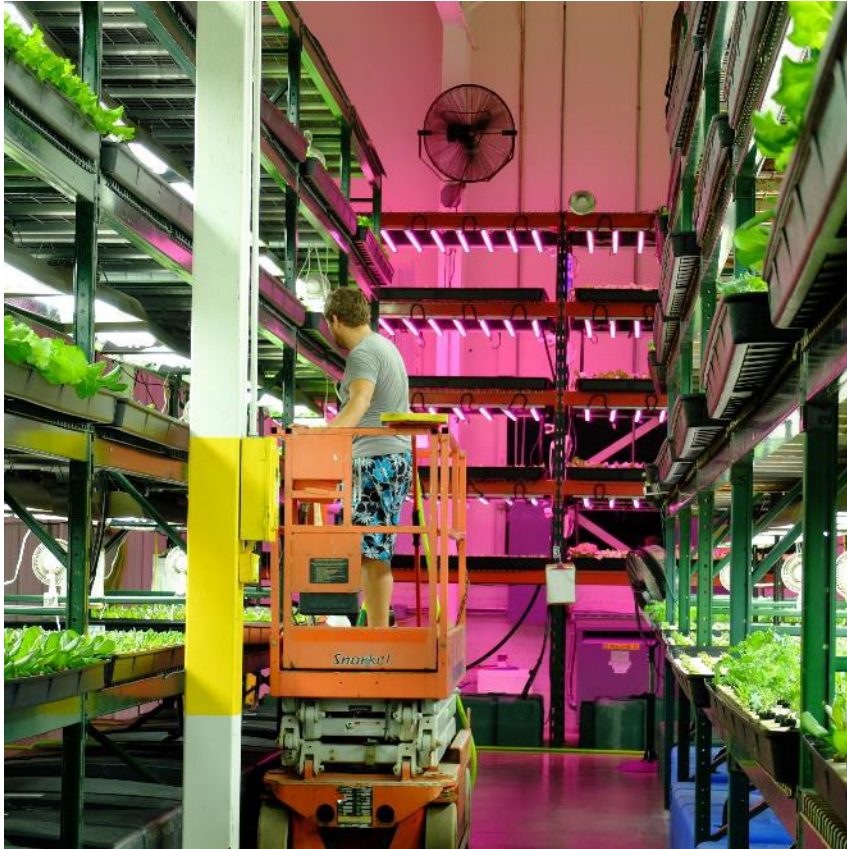
Green Spirit Farm, New Buffalo / E. Fargetton, Astredhor