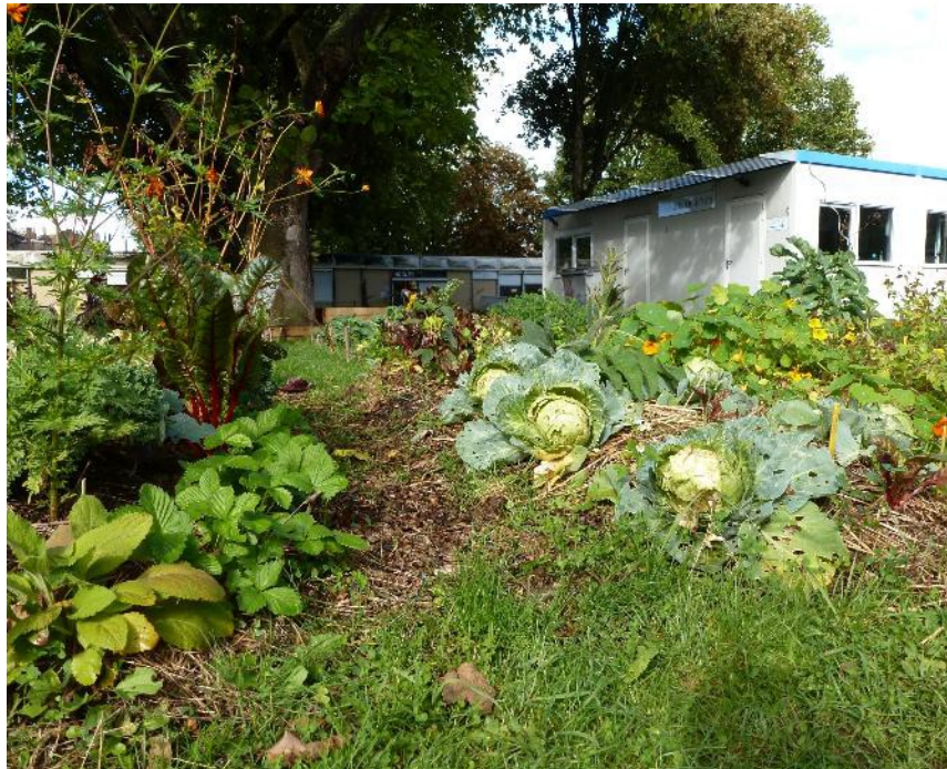
Potager expérimental collectif, Lille