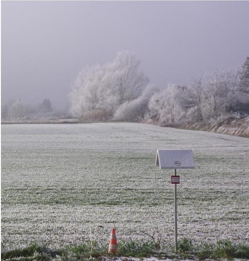
Triangle vert, Essonne