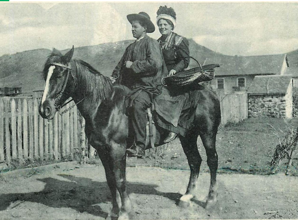
6250 Notre Auvergne — Paysan et paysanne revenant de la foire