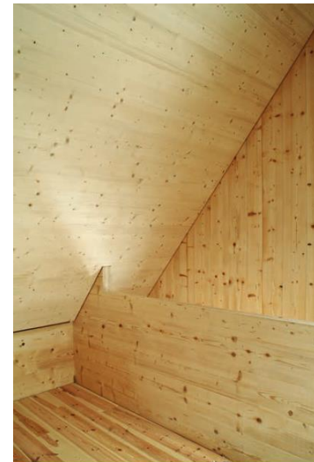
Kostner House, Dolomites, Italie