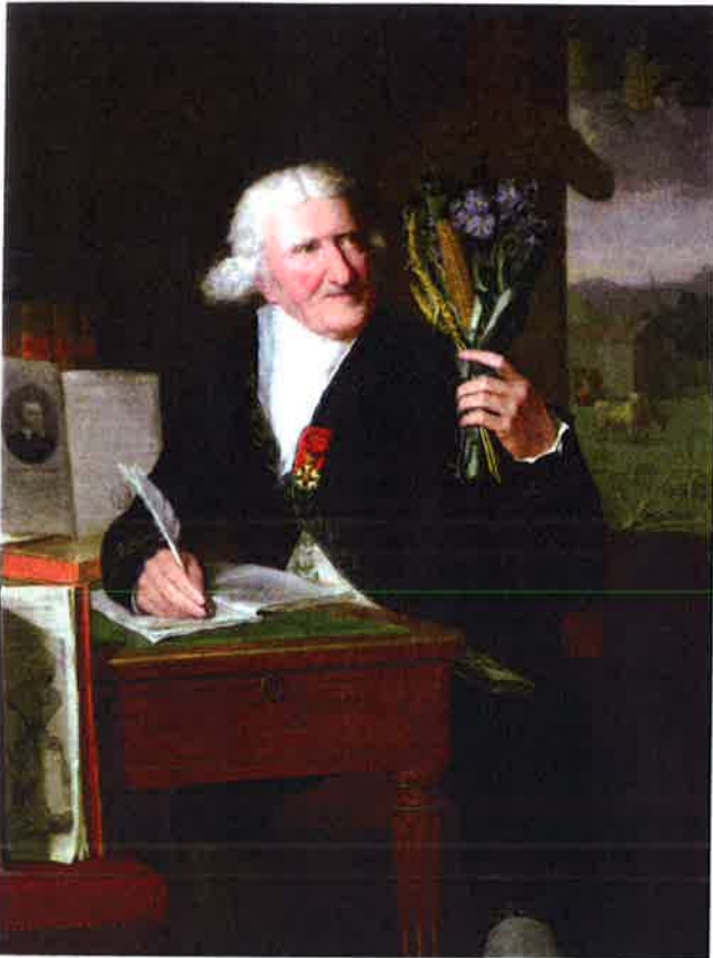
Image 7 : Portrait d'Antoine-Augustin Parmentier, salle du Conseil de la Faculté de Pharmacie Paris Descartes, attribué à un élève de François Dumont

celui qui a permis sa large adoption puis son développement considérable au XIX e siècle : « Mes recherches n'ont eu d'autres buts que les progrès de l'art et le bien général. La nourriture du peuple est ma sollicitude, mon vœu, c'est d'en améliorer la qualité et de diminuer le prix [...]. J'ai écrit pour être utile à tous ».