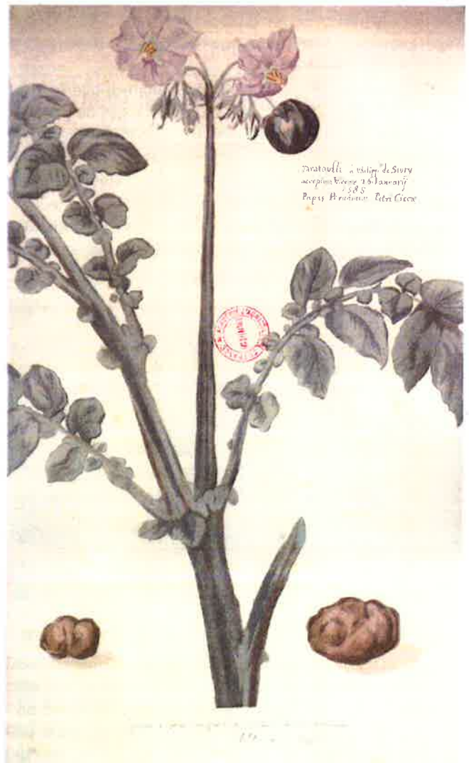
Image 4 : Première illustration de la pomme de terre envoyée à Clusius par Philippe de Sivry en 1588 (Taratoufli...).

Une première description botanique de la pomme de terre est due à G. Baulin en 1596 : il lui donne le nom de Solanum tuberosum en ajoutant esculentum qui traduit son caractère à destination alimentaire. Autour de la fin du XVIe et du début du XVIIe siècles, la place prise dans les herbiers, collections et jardins européens devient conséquente et justifie des illustrations imprimées (image 4).