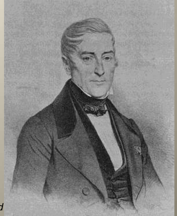
Louis Etienne vicomte Héricart de Thury