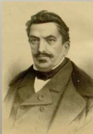
Louis Van Houtte