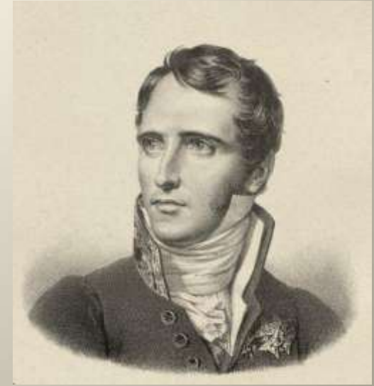
Duc Elie Decazes