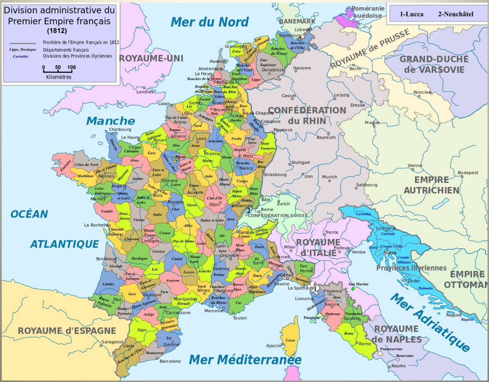
L'empire administratif français à son apogée