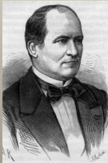
Baron Georges Eugène Haussmann