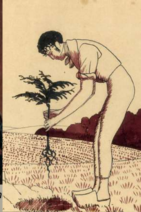
François René de Chateaubriand