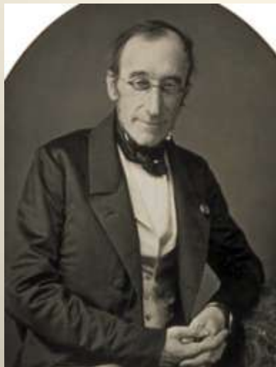
Adrien de Jussieu