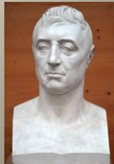
Gilbert du Motier de la Fayette