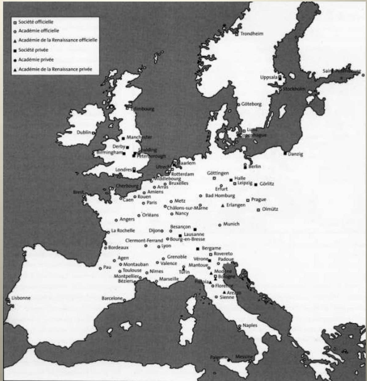
Les academies en Europe avant la révolution française