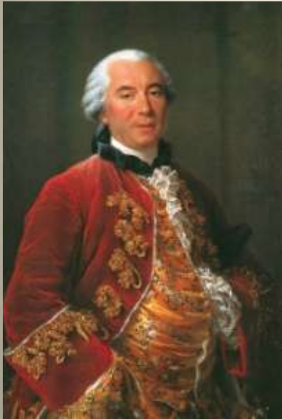
Georges-Louis Leclerc de Buffon