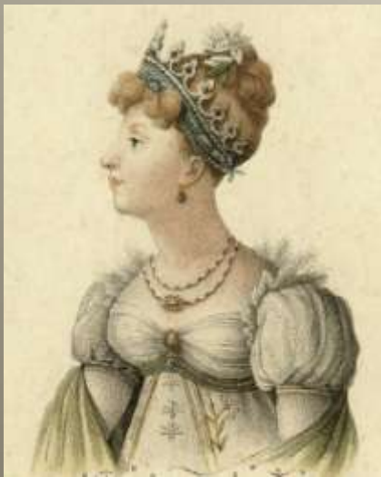
Marie Caroline de Berry