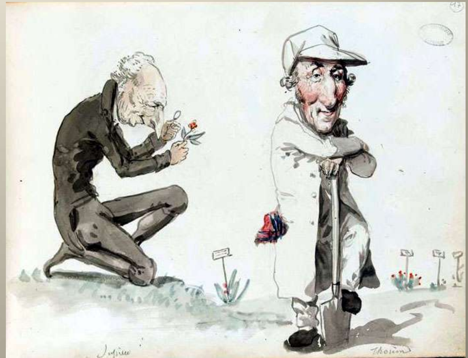
Jussieu et Thouin par Boilly

Le décret du 10 juin 1793 crée le Muséum national d'histoire naturelle et en confie la gestion à un collectif de dix professeurs