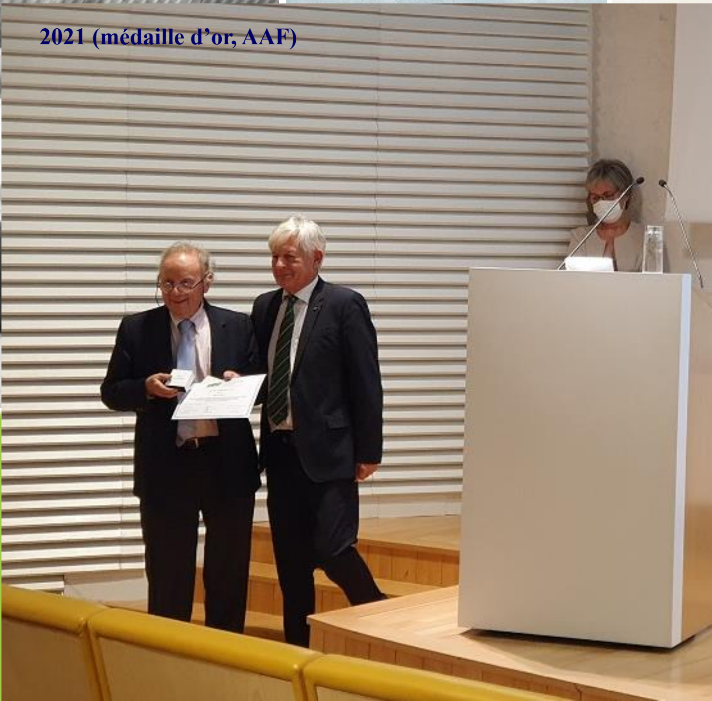
2021 (médaille d'or, AAF)