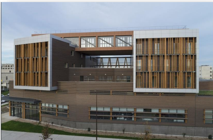
Siège de FCBA à Champs-sur-Marne

Le bois construction est majoritairement encore résineux et « tire » l'ensemble de la filière. Le dicton : « quand le bâtiment va, tout va » est parfaitement vérifié dans la filière. Dans la crise récente 2009-2015, si les entreprises construction ont un peu moins souffert que les autres, grâce en partie à la rénovation mais aussi du fait du regain d'intérêt pour le matériau, l'effet dépressif s'est fait largement sentir en 2016, notamment dans le secteur de la maison individuelle.