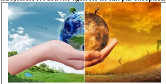
Figure 2 : Protéger l'environnement

Car en émettant près de 14 % des gaz à effet de serre dans l'atmosphère (et même le double si on ajoute les industries d'amont et d'aval), l'agriculture contribue de manière significative au réchauffement climatique : elle émet en effet du gaz carbonique, des dérivés de l'azote et du méthane, ce dernier étant produit par les ruminants et les rizières ( Figure 2 ).