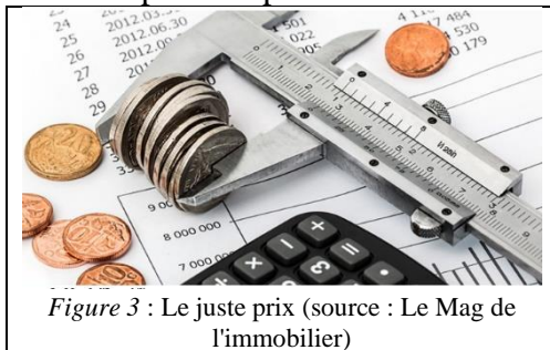
Figure 3 : Le juste prix

Face aux négociants, aux industriels et à la grande distribution, les agriculteurs – même groupés en coopératives – sont bien démunis pour obtenir une augmentation de leurs prix de vente. C'est un combat difficile alors que les pouvoirs publics, a priori favorables, souhaitent aussi des prix bas pour les consommateurs les plus modestes ( Figure 3 ).