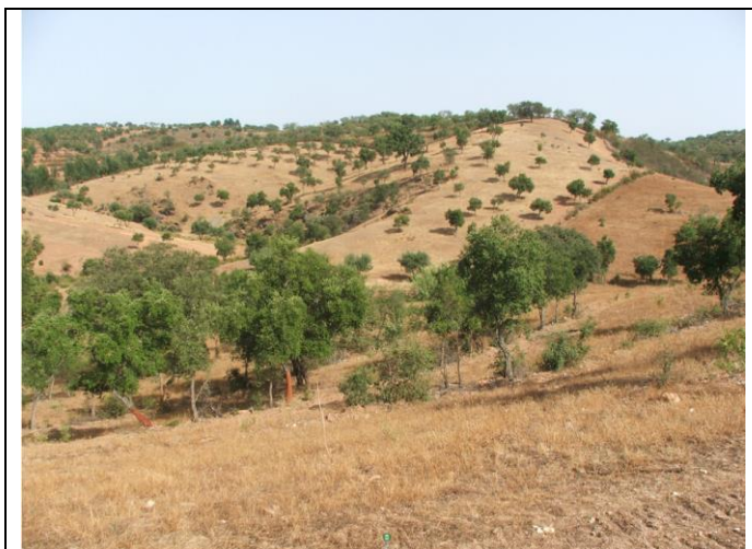
Figure 2 : Communal de Serra de Serpa. La photographie met en évidence la topographie ondulée, l'absence de perspectives et la variété des formes et des orientations. À cette échelle "paysagère", la géométrie du lotissement est complètement imperceptible.

Le baldio aurait été attribué à la communauté de Serpa, avec exemption de jugada (impôt sur les terres cultivées) en même temps que celle-ci recevait sa charte de coutumes ( foral ) en 1295, par le souverain D. Diniz. On connaît des dispositions législatives des rois portugais concernant l'apiculture ; ici, nous sommes renseignés par les précieux compromissos réglementant l'apiculture dans la Serra. Ces documents attirent immédiatement l'attention sur l'ampleur de cet élevage, avec un total d'environ 10 000 ruches. Le compromis de 1368 avait pour but de réguler l'institution des malhadas foreiras , exploitations apicoles autorisées et enregistrées dans un document archivé par la communauté. C'est alors qu'apparaissent le