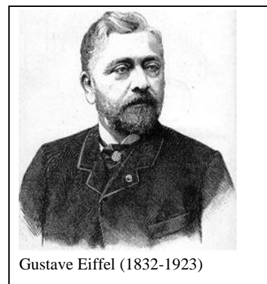
Gustave Eiffel (1832-1923)