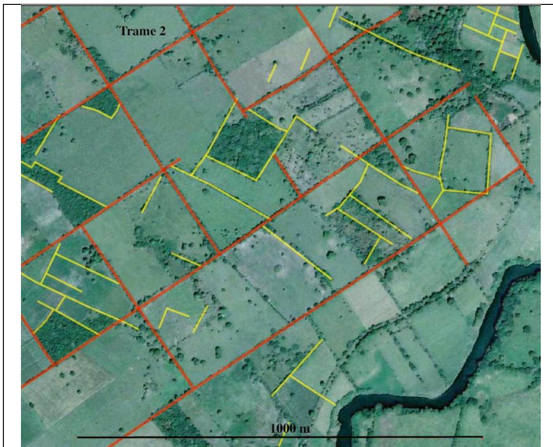
Figure 3 : Lecture de l'ancien parcellaire antérieur à la division géométrique de l' ejido (capture du géoportail de Google Earth).

Plusieurs secteurs des trames étudiées présentent des indices du parcellaire antérieur, transformé lors de la division de l'espace remis à l' ejido et partagé entre les ejidatarios ; ces indices peuvent être de nature permanente ou fossile. L'exemple ci-dessous ( ejido Bodegas de Totoltepec) appartient à la trame 2, au contact avec la trame 10.