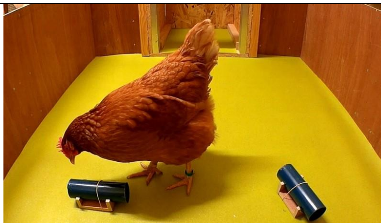
Figure 3 : Test permettant d'évaluer une forme de raisonnement (capacité d'inférence par exclusion) chez la poule domestique. Lors de ce test, la poule entre dans une arène qui contient deux tubes, et dont seulement l'un contient de la nourriture. Sur la photographie, le tube situé à la gauche de la poule est tourné vers elle, de telle sorte qu'elle peut voir l'intérieur du tube et donc s'il contient ou non de la nourriture ; dans ce cas, ce tube ne contient pas de nourriture. Si la poule est capable d'inférence par exclusion, elle doit déduire que la nourriture est dans le tube placé à sa droite et se diriger directement vers ce dernier.

Toutefois, bien que les animaux d'élevage démontrent des capacités cognitives insoupçonnées, il serait