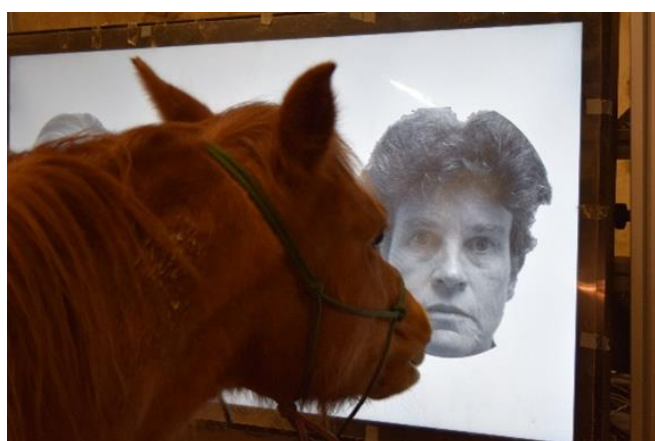
Figure 1 : Reconnaissance de l'humain sur simple photo

Selon la littérature disponible en 2024, ces animaux sont capables de véritables prouesses, comme reconnaître individuellement les visages de leurs soigneurs, détecter leurs émotions à travers leurs odeurs ou leurs expressions faciales, et même comprendre leurs intentions. Par exemple, les moutons et les chevaux peuvent identifier leur propre soigneur sur des photographies ( Figure 1 ), tandis que les porcs sont en mesure de comprendre les gestes de communication d'un humain. Ces résultats témoignent d'un haut niveau dans le domaine de la cognition sociale interspécifique.