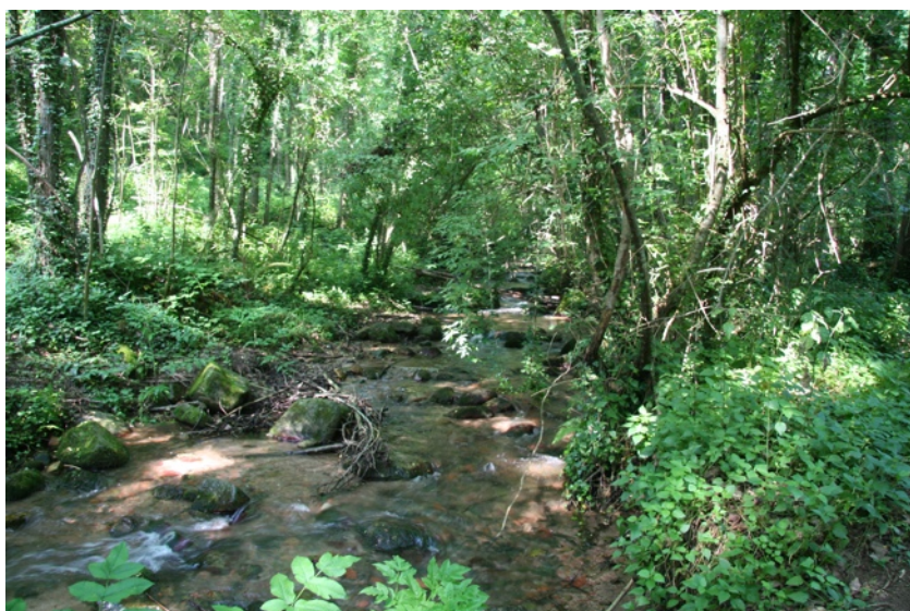
Ci-dessus : ripisylve à aulne glutineux