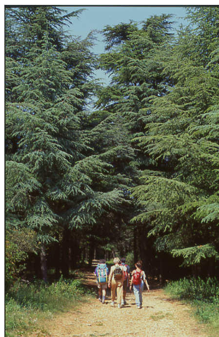
Ci-contre : promenade dans la cédraie du Luberon