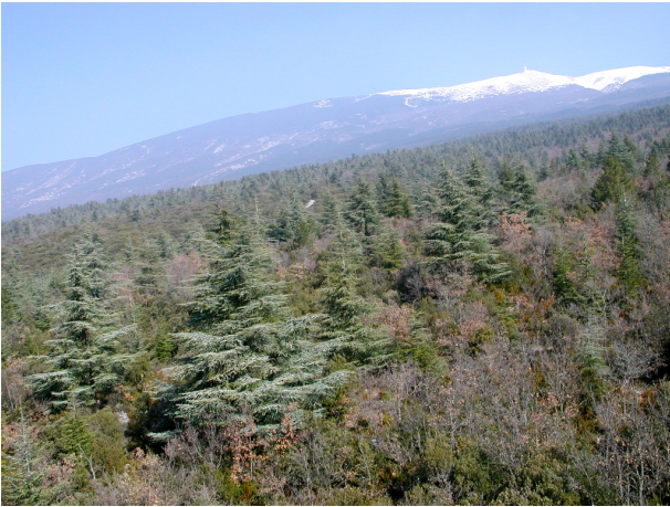
Figure 4. Exemple historique réussi de migration et gestion assistées : on favorise la régénération du cèdre (espèce exotique introduite seconde moitié du 19 ème siècle) par rapport au hêtre plus vulnérable au CC sur les pentes du Mont Ventoux (Vaucluse)