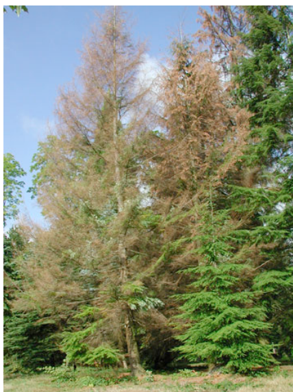
Figure 1. Mélèzes gravement affectés par la sécheresse

Le terme adaptation a plusieurs significations. Il peut désigner un état : celui d'une forêt, d'un individu ou d'un caractère ; il rend compte de l'adéquation d'un système biologique aux conditions environnementales à un instant donné. On dit par exemple qu'une population est adaptée à son environnement. Adaptation se dit également des processus écologiques et évolutifs sous-tendant l'ajustement des fonctions biologiques d'un être vivant avec les conditions extérieures et leurs évolutions. Enfin, ce terme peut signifier l'ensemble des actions anthropiques , comme la gestion et les politiques forestières, qui se fondent sur ces processus, pour améliorer et accélérer les ajustements des écosystèmes forestiers aux conditions nouvelles, et limiter leur vulnérabilité. C'est cette définition qui constitue l'objet de la présente fiche. Il faut aussi évoquer l' adaptabilité , c'est à dire la plus ou moins grande aptitude d'un système biologique à s'ajuster grâce aux processus évolutifs naturels.