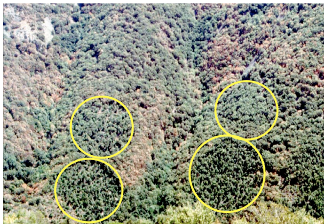
Figure 3. L'éclaircie expérimentale (parcelles circulaires) pratiquée dans un taillis de chêne vert en Catalogne fait apparaître en année sèche une meilleure résistance des zones traitées.

Il peut être intéressant à court terme d'avoir une population adaptée à des conditions locales changeantes, tandis qu'à long terme il s'agit de se préparer à faire face à des incertitudes sur les besoins adaptatifs futurs. Des compromis seront parfois nécessaires. Ainsi, on observe que les arbres ou les peuplements soumis à un stress régulier modéré récupèrent aussi plus rapidement lors de stress plus prononcés : dès lors, l'objectif ne sera pas toujours d'éliminer complètement le stress, mais parfois aussi simplement de le maintenir à un niveau acceptable pour malgré tout favoriser l'acclimatation. Autre exemple, on peut cibler à court terme certaines adaptations, alors qu'à long terme il est préférable de privilégier un niveau élevé de diversité.