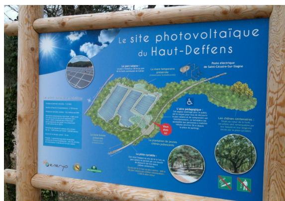
Figure 5. L'implantation de centrales solaires en forêt : une nouvelle source de controverse - Photo: Carpe Diem, Caillan (Var)

L'idée d'absorber la plus-value liée à un changement de destination d'un terrain n'est pas nouvelle. La dernière application qui en a été faite par le droit forestier affectait le droit de défricher. Le peu d'effet qui en est résulté ainsi que les mesures de simplification fiscale poursuivies ont provoqué la disparition de ce qui était nommé « taxe sur le défrichement. » Nous avons constaté qu'un défrichement pouvait faire l'objet d'un boisement compensateur. Cette mesure de conservation purement administrative peut être substituée par un versement financier. L'article L. 341-6 du Code forestier autorise le versement d'une somme au Fonds stratégique de la forêt et du bois (art. L. 156-4 du Code forestier) dont l'objet est le financement de projets d'investissement, prioritairement en forêt, et d'actions de recherche, de développement et d'innovation (fig. 5)