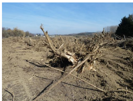
Figure 1. Défrichage

Le Code forestier (CF) définit le défrichage (fig.1) comme l'action de supprimer les bois et forêts existants par dessouchage ou gestion «régressive», ou encore d'en modifier la destination même sans enlever les bois existants (par exemple, un camping où aucun arbre ne serait enlevé). Pour procéder à un défrichage, une autorisation administrative est obligatoire. Elle est dérogoire du droit commun de disposer de sa propriété et donc encadrée par la loi qui en définit les motifs essentiellement liés à la protection des sols, des eaux et de la biodiversité locale (article L. 341-5 du CF). Elle tient le droit de construire en