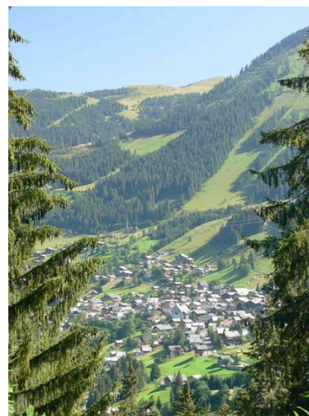
Figure 3. Forêt de protection au-dessus de Châtel

Le classement en forêt de protection (Code forestier, art. L.141-1 et suivants) est aussi appelé « petit régime forestier » pour son strict contrôle par l'Administration des forêts. Il représente environ 150 500 ha en France. Le classement en forêt de protection (fig.3) résulte d'une procédure lourde : par décret motivé en Conseil d'Etat après enquête publique et avis de la commune et de la commission départementale de la nature, des paysages et des sites. La loi détermine ses motifs : maintien des terres sur les montagnes et sur les pentes, défense contre les avalanches, les érosions et l'envahissement des eaux et des sables, écologie et bien-être de la population dans la périphérie des grandes agglomérations. Il s'agit de protéger la forêt pour ses fonctions écologiques et sociales et non économiques. La gestion forestière quel qu'en soit le propriétaire, est soumise au contrôle direct de l'Administration. Tout changement d'affectation est strictement interdit. Une procédure de délaissement est prévue en cas d'opposition entre l'Administration et le propriétaire, voire de compensation (L. 141-7 et R. 141-39 à 42).