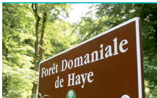
Figure 2. En forêt domaniale (ONF)

dans les mêmes conditions que le territoire métropolitain, sauf diverses mesures d'exception (fiche 1.04). Les bois et forêts relevant du régime forestier doivent figurer à titre informatif en annexe des plans locaux d'urbanisme ( C. urb., art. R. 151-53 ).