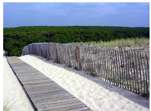
Figure 5. Sommet de la dune bordière de Mimizan (Landes). En arrière, les anciennes dunes mobiles fixées par la forêt.

«Les dunes calibrées d'Aquitaine sont, au niveau européen, un des exemples les plus démonstratifs d'une action continue de contrôle des dunes côtières par l'homme» (J. Favennec).