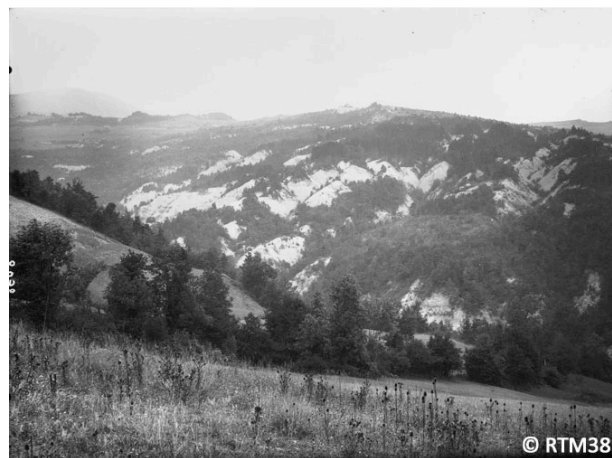
Figure 4. Reboisements RTM : vue d'ensemble du site de Sinard (Isère), à gauche en 1886, et à droite en 1929 après reboisement.

Outre l'élaboration d'une véritable idéologie articulée sur les concepts et les objectifs de la RTM, l'Administration des Forêts, à qui fut confiée la mise en œuvre de cette politique, réussit à produire un corpus de méthodes et de technologies fondées sur les idées et travaux novateurs de Surrel et Demontzey. Les opérations, focalisées sur l'amont des bassins versants et/ou dans des zones vulnérables, avaient recours à une combinaison de techniques : i) revégétalisation ou recolonisation, avec des arbres (espèces locales et Pinus nigra ) sur les pentes, des arbustes et des plantes herbacées le long des rives et dans les ravines, et la réalisation complémentaire de profilage en gradins ; ii) génie civil avec la construction de barrages en séquence dans le lit du torrent pour réduire son érosion et celle des rives, tout en limitant le transport des matériaux. Les réalisations de la RTM peuvent être résumées en quelques chiffres : i) 260.000 ha reboisés ; ii) 110 torrents traités ; iii) 100.000 petits barrages construits ; iv) travaux réalisés sur 115 zones de glissements de terrain et 100 couloirs d'avalanche ; v) 950 communes concernées dans 25 départements de moyenne et haute montagne. Avec un recul de 150 ans, cette politique publique de la RTM peut être considérée comme un grand succès ; elle a d'ailleurs inspiré d'autres pays européens.