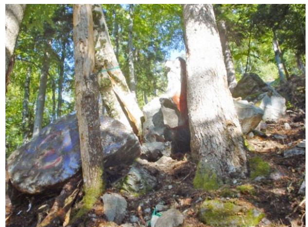
Figure 3. Blocs arrêtés par un groupe d'arbres :

Les forêts de montagne ont également une importante fonction de protection contre les chutes de blocs et de pierres, qui se produisent en général aux périodes de fort contraste thermique : automne et début du printemps. Certes, celles-ci font partie des processus naturels d'évolution des versants d'une montagne, mais elles menacent aussi les zones urbanisées et les infrastructures routières situées en aval. On peut s'en prémunir par des ouvrages de génie civil (filets installés à même le versant, merlons situés en bas de pente), mais aussi par des peuplements forestiers dont les arbres peuvent arrêter les blocs (fig. 3). Si la forêt est gérée de manière à optimiser sa fonction «pare-bloc», elle peut être une option de génie biologique très crédible, économiquement et écologiquement, par rapport aux techniques de génie civil. En France, on estime que 40 % environ des forêts de montagne jouent pour tout ou partie un tel rôle.