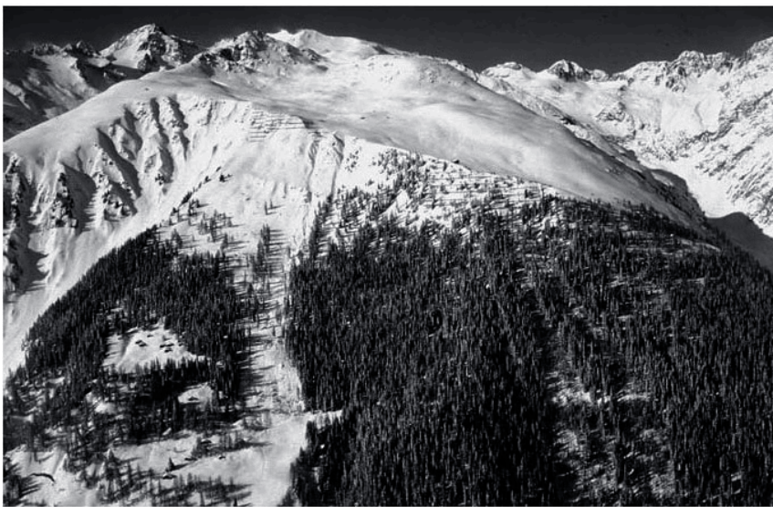
Figure 2. Forêt de protection dans le Valais. À gauche de la photo, on peut voir la zone de départ d'avalanche au dessus de la forêt. Les arbres présents au-dessous sont en partie détruits. À droite, la couverture forestière est complète y compris dans la zone de départ ; elle sert de protection contre les avalanches

La forêt de montagne peut être considérée comme « l'équipement » principal de protection contre les avalanches : sa fonction est d'en empêcher le déclenchement (fig.2). L'effet de fixation du manteau neigeux est lié à plusieurs caractéristiques propres à la forêt : i) une partie de la neige est interceptée par le feuillage où elle s'évapore et fond ; ii) une autre parvient au sol (la plus grande part) où elle bénéficie d'un microclimat qui tamponne les températures maximales et minimales, réduisant ainsi l'apparition de givre au sein du manteau neigeux ; en zone nue, ce givre peut créer des couches fragiles et instables ; iii) un peuplement forestier dense limite la capacité du vent à accumuler de la neige ; iv) les troncs par leur ancrage racinaire dans le sol contribuent également à la fixation du manteau neigeux. Il faut bien préciser que la forêt ne joue pleinement son rôle paravalanche que si elle est implantée dans la zone de départ d'avalanches. En revanche, si la zone de départ est située en amont de la forêt, alors cette dernière peut subir de gros dégâts en cas d'avalanche.