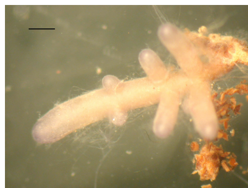
Figure 1. Racine d'épicéa ectomycorhizée par le Laccaria amethyste ( Laccaria amethystina )

Dans les forêts tempérées et boréales non perturbées, les racines des grandes essences (par exemple Pins, Epicéa, Chênes, Hêtre) portent généralement des ectomycorhizes qui peuvent être formées par plusieurs centaines d'espèces de champignons basidiomycètes (par exemple Amanites et Bolets) et ascomycètes (par exemple, les Truffes). Morphologiquement, on distingue une racine courte ectomycorhizée d'une racine courte non mycorhizée par la présence du manteau externe formé d' hyphes fongiques (filaments microscopiques de 5 à 100 µm de diamètre qui constituent l'appareil végétatif du champignon) recouvrant la première (Fig. 1) Les hyphes de ce manteau se développent d'une part vers l'intérieur de la racine, en s'insinuant entre les cellules du cortex racinaire, et d'autre part vers l'extérieur en formant un mycélium (appareil végétatif du champignon constitué d'hyphes interconnectés entre eux) qui explore le sol. Alors que la croissance des hyphes à l'intérieur de la racine est limitée à la partie périphérique de la racine (pas d'entrée dans les vaisseaux conducteurs des sèves), la croissance des hyphes externes peut