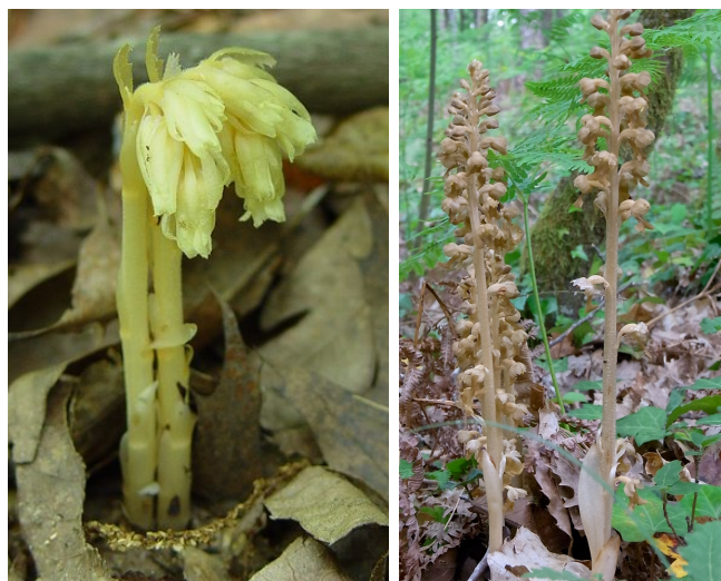
Figure 4. Les plantes mycohétérotrophes forestières sont entièrement nourries par le réseau mycorhizien qui les relie aux arbres. A gauche, le Monotrope ou Sucepin ( Hypopitys monotropa , une éricacée) ; à droite, la Néottie ( Neottia nidus-avis , une orchidée).

Le réseau mycorhizien permet à ces plantes de vivre à l'ombre de nos forêts... Dans les sous-bois tropicaux, sous l'ombre dense des canopées épaisses, de telles espèces sans chlorophylle abondent, parmi lesquels des représentants sans chlorophylle des familles des gentianes par exemple. Elles sont nourries, grâce à des champignons partagés avec les racines des arbres de la canopée... Les arbres semblent avoir gagné la compétition pour la lumière, mais ils sont en fait rattrapés par de plus petites plantes qui, dans leur ombre, utilisent les réseaux mycorhiziens !