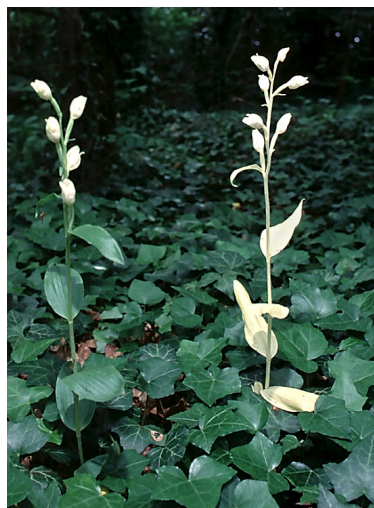
Figure 3. Chez les orchidées forestières mixotrophes, normalement vertes, des individus sans chlorophylle survivent parfois, nourris par le réseau mycorhizien. On voit ici deux pieds de Céphalanthère pâle ( Cephalanthera damasonium ), l'un vert à gauche (le type habituel de l'espèce) et l'autre dépourvu de chlorophylle à droite.

Chez certaines orchidées mixotrophes de surcroît, de fantomatiques mutants blancs, ayant perdu toute chlorophylle (Fig. 3), survivent plusieurs années, entièrement nourris par leurs champignons mycorhiziens (Roy et al., 2013) ... Certes, ils produisent moins de graines, car les ressources de la photosynthèse leur font défaut, mais ils démontrent le rôle nutritif du réseau pour les espèces mixotrophes, chez qui la photosynthèse devient facultative. De plus, de tels mutants de plantes mixotrophes ont sans doute engendré les espèces sans chlorophylle : ces espèces forestières totalement non-chlorophylliennes, mais non parasites directes d'autres plantes, sont entièrement nourries par les champignons qui forment des réseaux mycorhiziens : on les dit mycohétérotrophes, comme la néottie nid-d'oiseau ( Neottia nidus-avis ; Fig. 4), une orchidée, ou encore le monotrope ( Hypopitys monotropa ), une éricacée.