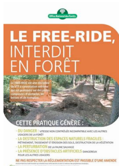
Figure 1. Panneau d'interdiction du «free ride» en forêt publique

Le «droit» de promenade ou de passage arrive largement en tête : les visites annuelles de forêts en France se situent entre 200 et 700 millions selon les estimations. Lieu généralement ouvert, la forêt est considérée dans l'opinion comme un lieu accessible à tous, voire parfois comme non approprié et donc patrimoine de la nation. Le droit de propriété qui s'y exerce légalement, que ce soit dans les forêts domaniales ou de droit privé, reste enfoui dans les consciences, le «droit» à la promenade voire à la nature et au paysage primant tout autre considération. Tant et si bien que fleurissent depuis quelques dizaines d'années des pancartes rappelant les droits mais aussi les devoirs de chacun (fig.1). Car le « passage innocent » que relève le droit pour admettre qu'il n'y a pas de sanction vis-à-vis du promeneur s'est traduit par des pratiques fort préjudiciables pour la forêt dans des cas certes particuliers mais nombreux. Ainsi, le piétinement par des milliers de visiteurs a conduit les forestiers à devoir canaliser les foules par des sentiers balisés, voire éducatifs, afin de les éveiller à la gestion forestière ou plus simplement à la vie des arbres. 450 agents (équivalent temps plein) de l'Office National des Forêts (O.N.F) y étaient dédiés en 2016.