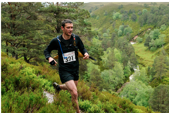
Figure 4. Course en forêt

Quelle différence ou connexité y-a-t-il entre ce que recherchent nos contemporains en forêt et ce que recherchaient les sociétés préindustrielles ? Entre la sensibilité à la forêt assimilée à la vraie nature et aux mystères redoutés de l'état sauvage ? Les besoins n'étaient pas les mêmes : résidence d'animaux propres à la chasse, mais lieux du loup qui vient à vouloir manger le Petit Chaperon Rouge. Réserve de bois nécessaire au feu de la cuisine et de la chaudière pour l'hiver, mais aussi lieu de refuge pour Blanche-Neige ou Robin des Bois. Aujourd'hui havre de silence et d'apparente harmonie qualifiée d'écosystème, contre la puissance et la brutalité du monde minéral urbain, secret que les arbres livrent pour que l'homme puisse découvrir sa propre mesure, contemplation du mystère contre les technologies de mise à nu du rapport de l'homme à lui-même. Il est significatif que les nouveaux usages sociaux de la forêt tournent la plupart autour du sport, c'est-à-dire du rapport de l'homme à son corps. Ces grandes formes vivantes que sont les arbres demeurent décidément une provocation à la contemplation, voire à l'émerveillement.