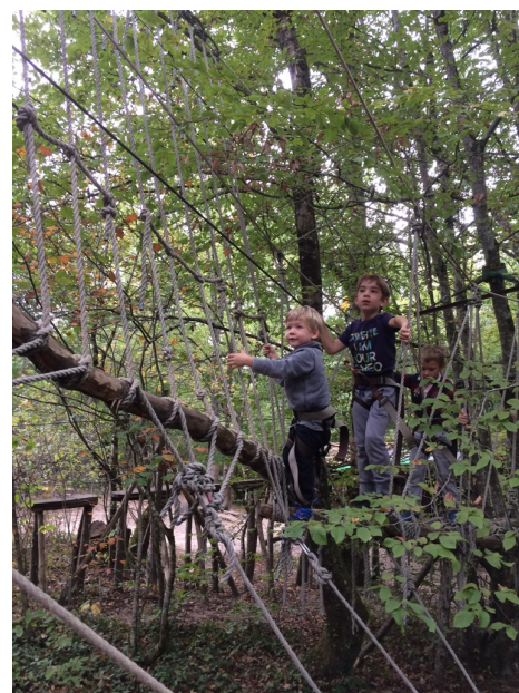
Figure 3. L'accrobranche : une activité plébiscitée par les jeunes

L'arbre devient dans ce cas un élément essentiel du sport ou de l'activité que l'on pratique : l'espace forestier est fermé, organisé et approprié à telle ou telle activité ; son entrée est payante. Classiquement, le ski ou encore le golf en sont des exemples courants et connus. Les parcours boisés rendent leur pratique agréable à la fois par leur paysage, mais aussi par leur effet de maintien des terres ou de la neige, voir par leur ombrage. Les accrobranches (fig.3) nés il y a une quinzaine d'années se sont largement développés puisqu'au nombre de près de 800 en France actuellement. Les arbres de haut jet supportent tyroliennes, échelles, câbles, élastiques, cordages en tous genres horizontaux ou verticaux, etc. Le nombre d'ateliers c'est-à-dire de changements de caps ou de hauteur est variable. Les sécurités s'apparentent à celles en pratique dans l'escalade. Ouverts essentiellement 6 mois par an, les accrobranches reçoivent des jeunes principalement avec une nette majorité de scolaires. La forêt demeure un support mieux apprécié que des mats de béton ou d'acier qui pourraient présenter le même usage