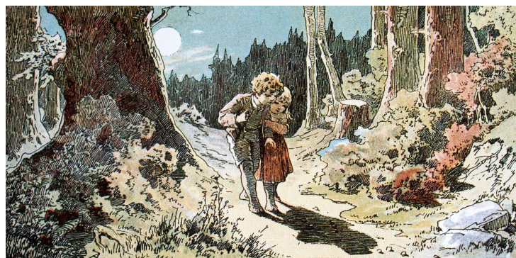
Figure 2. Hansel et Gretel - Contes de Grimm (illustrés par Alexander Zick)

La forêt occupe une place importante dans les contes, notamment par son côté mystérieux. C'est le cas chez Charles Perrault, au XVII e siècle, dans La Belle au bois dormant , repris plus tard par les frères Grimm où, lorsque la princesse s'endort, une haie d'épine se met à pousser autour du château qui devient une forêt quasi impénétrable. C'est le cas aussi dans Le petit Poucet encore plus inquiétant puisque l'ogre y réside : « Tu vois bien que nous ne pouvons plus nourrir nos enfants...je suis résolu de les mener perdre demain au bois ». Dans l'œuvre importante du fabuliste Jean de La Fontaine, la forêt occupe la place