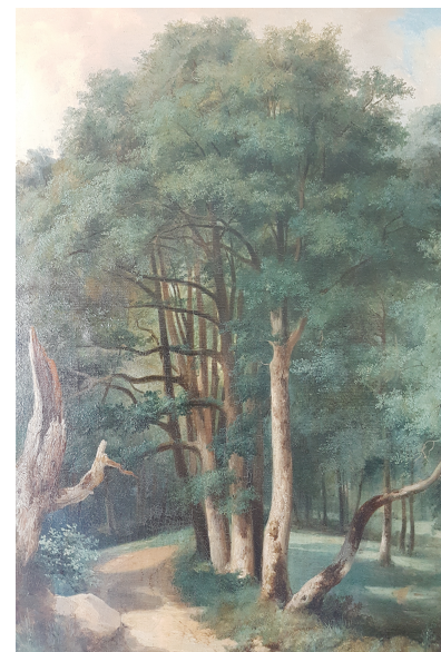
Figure 4. « En forêt » de Jules Coignet

Enfin, de sa fonction de production, il n'est fait que rarement état, par exemple chez Raymond Queneau : « Le bûcheron et sa cognée, font des trous dans la forêt. Tout au bout l'on aperçoit, une scierie pour le bois. La scierie est dynamique, la scierie est prolifique, les usines poussent comme petits pois, la forêt n'est plus qu'un bois ».