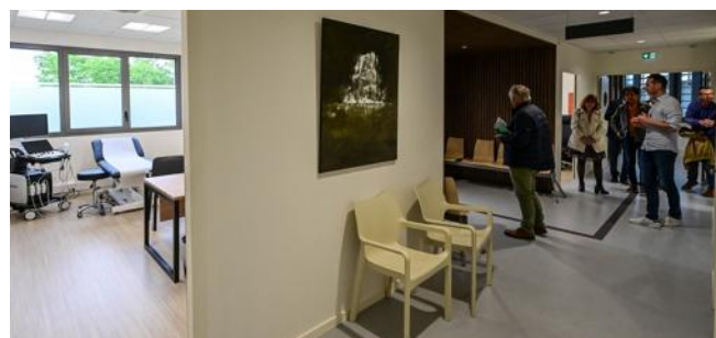
Le bâtiment, sur deux niveaux, s'étend sur 1 400 m 2 . Il comporte quatorze salles de consultation.

Les quinze praticiens de Cardioptim et leurs employés administratifs occupent depuis cinq mois de nouveaux locaux, situés aux Tilleroyes à Besançon. L'édifice à deux niveaux, que dix associés ont financé en fonds propres et emprunts, s'étend sur 1 400 m 2 . Ces rythmologues, cardiologues et angiologues bénéficient de quatorze salles de consultation, équipées de matériels médicaux et de mesures ultramodernes. L'investissement total,